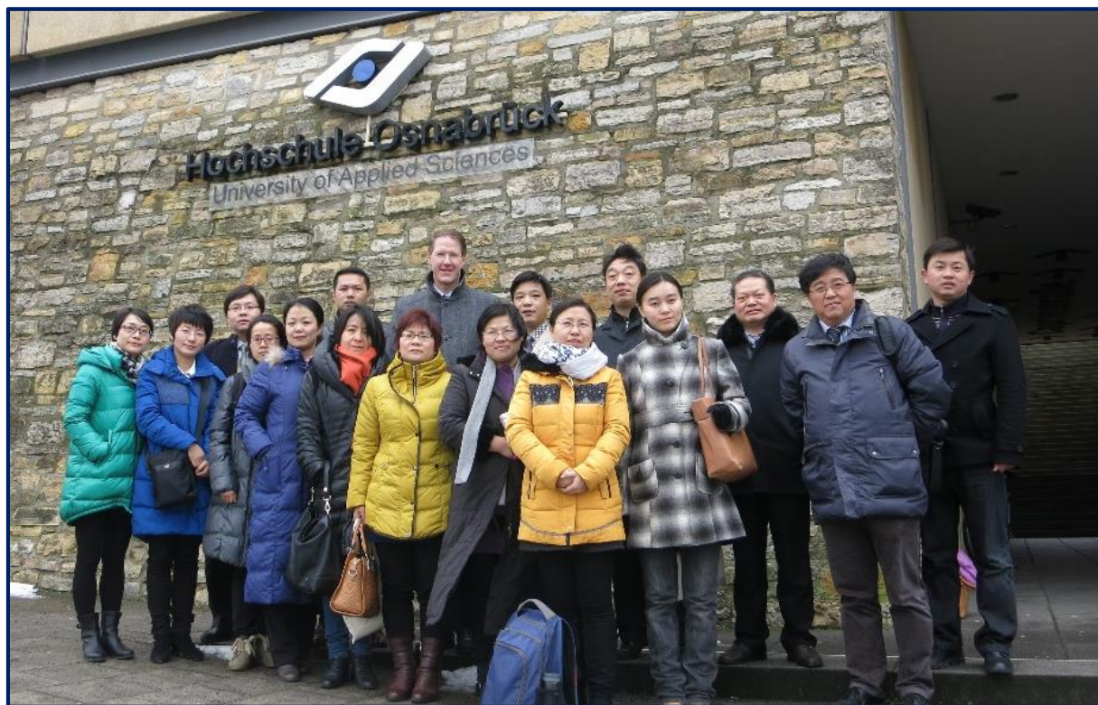
合肥学院第五批培训团

2015年2月2日至6日，合肥学院第五次派培训团到我校学习。来自这所友好学校的15名教授参加了我们提供的为时一个星期的培训，培训的内容主要是以实践为导向的教学和教学计划的模块化。此外，我们还为中国的老师们提供了一些参观实验室的机会，使他们能够了解到实践导向性在我校的具体实施。