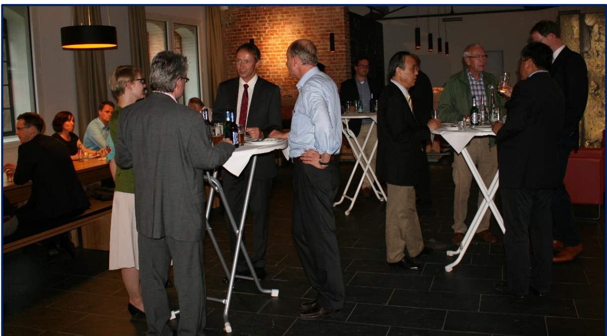
奥斯纳布吕克、埃姆斯兰特及本特海尔姆工商会与对华高等教育中心在卡皮里维生活馆举办中国碰头会

工商会驻中国的代表们首先就中国各个地区当前的经济发展状况做了主题报告。接下来，在轻松愉悦的气氛里，参会人员相互介绍认识，并就各自在中国的业务和经验进行了交流和探讨。此次碰头会受到了奥斯纳布吕克市和周边地区企业的极大好评，2016年我们将举办第二期。