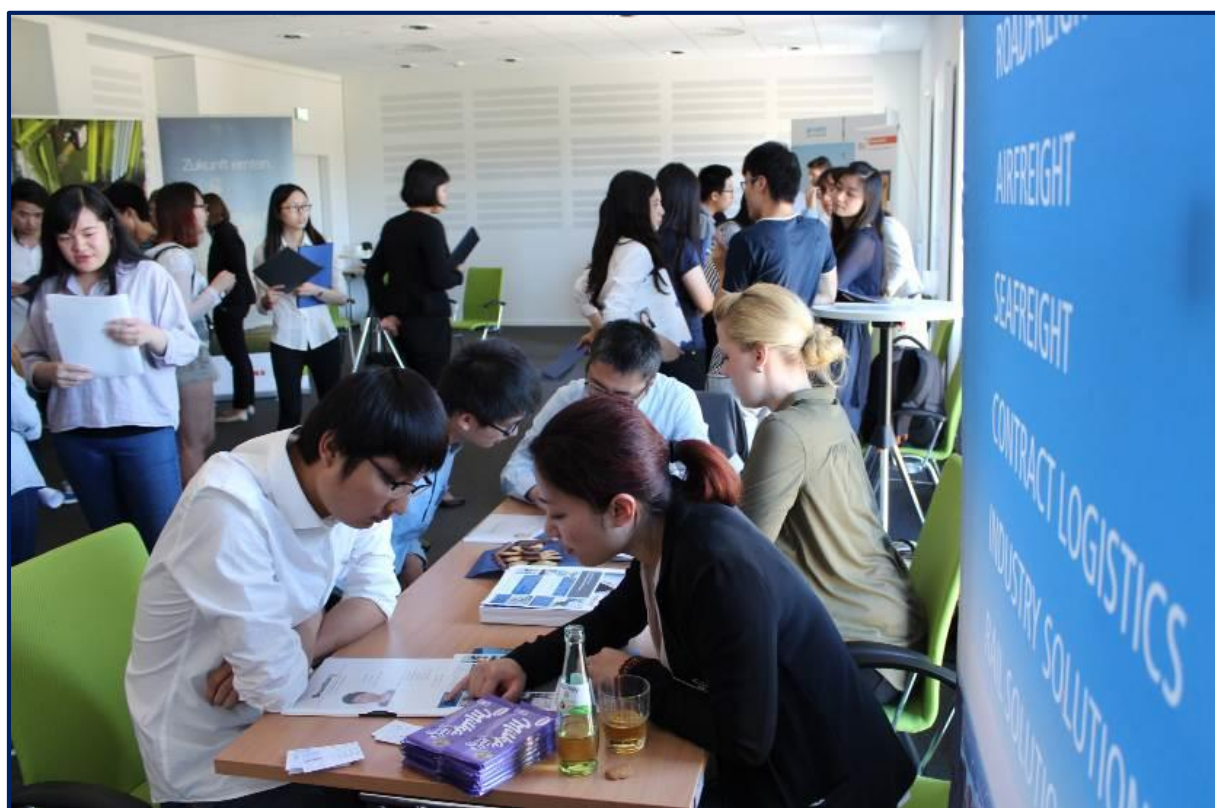
中德合作物流管理专业学生参加企业招聘会

招聘会举办前，学校的就业指导中心为这些学生举办了一次培训班，让他们为招聘会做好了准备。参与的企业对这种形式非常满意，并答应来年将再次参加招聘会。