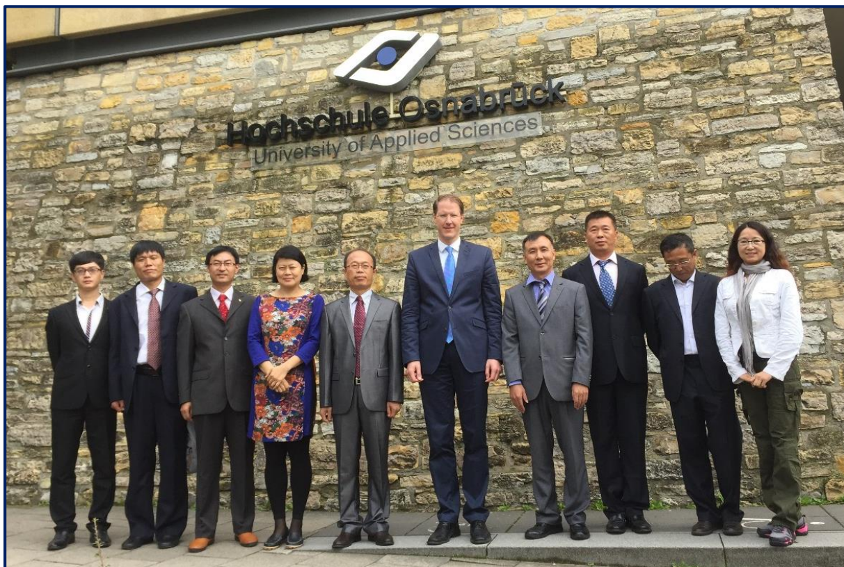
石家庄学院第二期培训班

石家庄学院第二次派代表团来到我校。2015 年 9 月 14 日至 26 日，9 名该中国高校的高层领导参加了我们提供的为期 2 个星期的培训班。对华高等教育中心精心安排的日程使中国高校的领导们能够深入地了解我校以实践为导向的教学是如何具体实施的。除了考察我校农业景观与设计学院、经济与社会学院和信息与工程学院，此次我们还把考察音乐研究所也列入了日程。